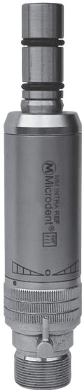
Micro Motor Intra 6030 (com refrigeração)