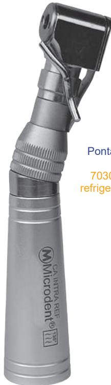
Ponta Reta Intra 7030 (com refrigeração)