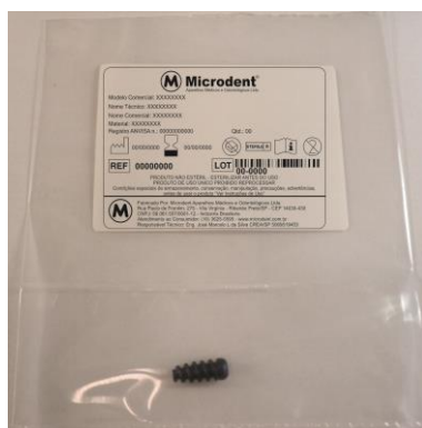
Figura 01: Produto dentro da embalagem com a rotulagem.

O MICRO INTER, é comercializado em embalagem plástica transparente de polietileno de baixa densidade (PEBD), selada termicamente, acompanhado de 05 Etiquetas de Rastreabilidade, como indicado na Figura 01.