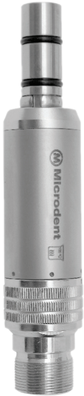
Micro Motor Intra 6000 (sem refrigeração)