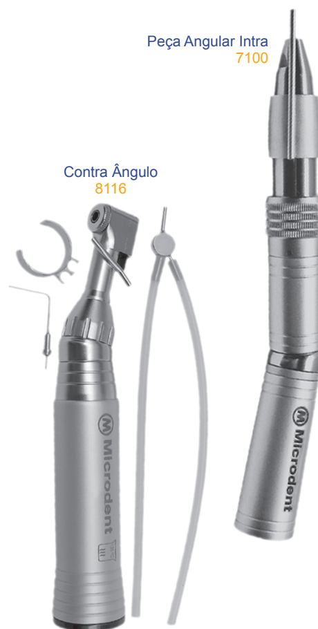
Peça Angular Intra 7100