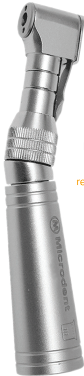
Contra Ângulo Intra 8000 (sem refrigeração)