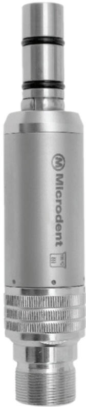
Micro Motor Intra 6000 (sem refrigeração)